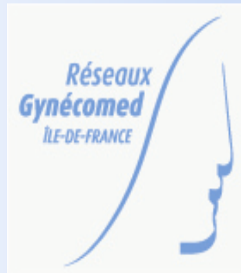
Tableau de Bord septembre 2016